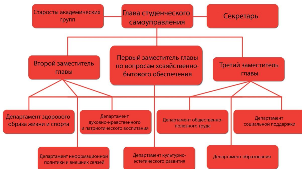
Схема 1 – Структура студенческого самоуправления ИИМОСПН